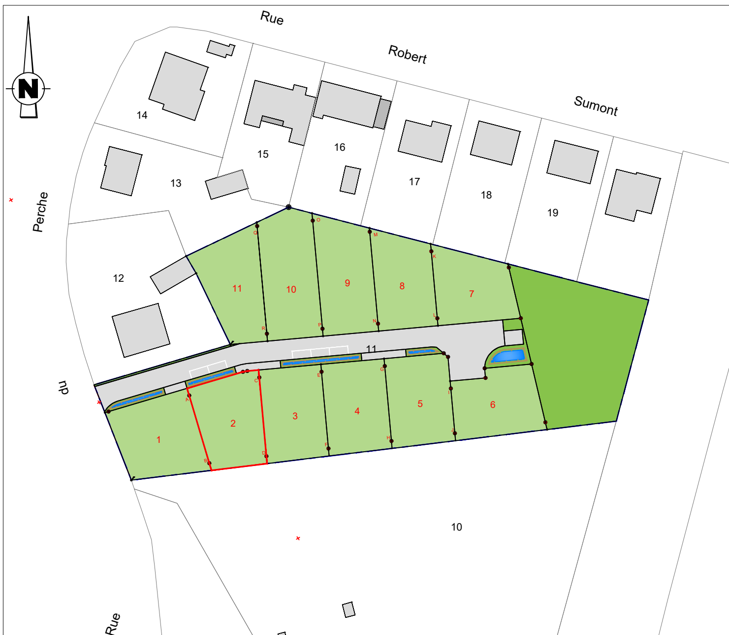
PLAN DE COMPOSITION Echelle 1/1000

Département de la Sarthe Commune de La Ferté Bernard "Le Bignon"